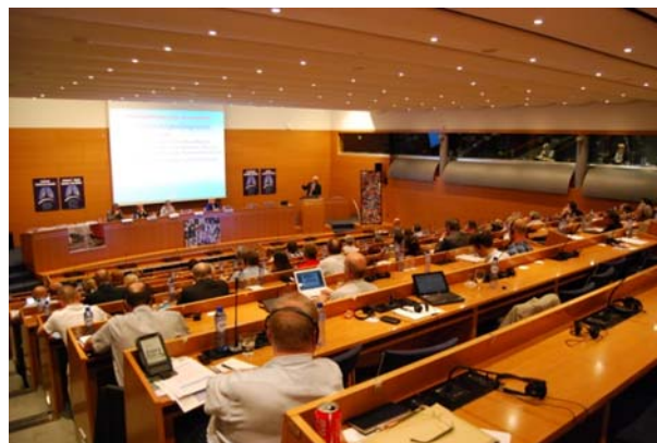
Obrázek 2: Diskuzní fórum v Bruselu, konference "Evropská azbestová katastrofa" ve dnech 17–18. září 2012.

Mezinárodní konference o azbestu jsou důležité pro podporu obětí a veřejnou mobilizaci. Bruselská konference s názvem „Evropská azbestová katastrofa“ („Europe's Asbestos Catastrophe“) ve dnech 17-18. září 2012 je příkladem mezinárodního setkání. Během dvoudenních diskuzních setkání delegáti hovořili o řadě aspektů problému včetně národních realit v oblasti azbestu, pracovní expozice a veřejných zdravotních rizik. Projednávali rovněž opatření pro minimalizaci rizik souvisejících s azbestem: legislativní řešení, lékařské protokoly a dekontaminační technologie. Tato konference o azbestu byla součástí projektu s názvem „Onemocnění související s azbestem v Evropě“ a byla zorganizována ve spolupráci s odbory a skupinami obětí azbestu (EFBWW, IBAS, ETUC, ABEVA) za finanční podpory EU. Více informací o této konferenci naleznete na webových stránkách IBAS 6 .