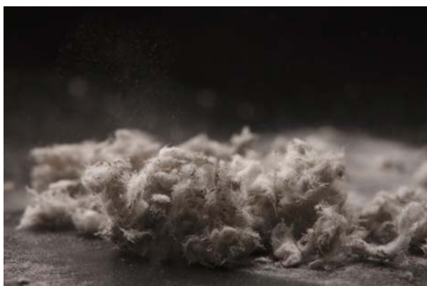
Obrázek 1: Azbest

Komerční využití s malými ohledy na kontrolu životního prostředí vzrostlo v průběhu 20. století, zejména v období silného ekonomického růstu po roce 1945. Jedinečné technické vlastnosti vedly k rozkvětu spotřeby. Azbest byl ve velkém množství využíván u budov a lodí a také pro řadu drobnějších aplikací, jako například u cigaretových filtrů. V prvních projektech pro jeho nahrazení v 80. letech bylo třeba nalézt alternativy pro víc než 3 000 způsobů technického využití.